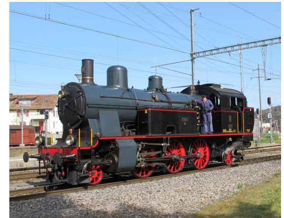
Eb 3/5 BT Nr.9, "Euphrosyne"