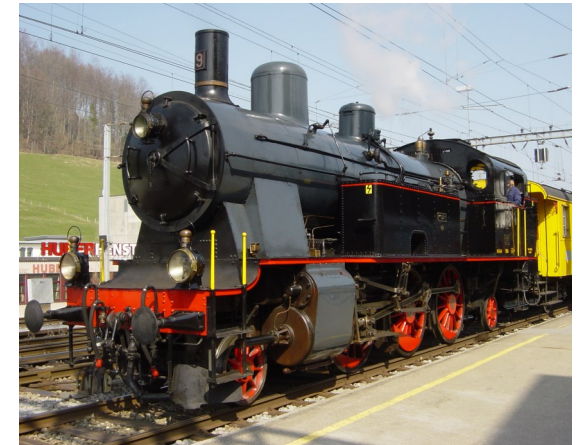
Eb 3/5 BT Nr.9, "Euphrosyne"